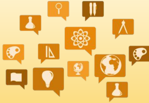
Educació integral i personalitzada